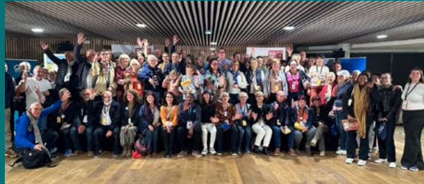
Les bénévoles de Quai des Bulles 2024