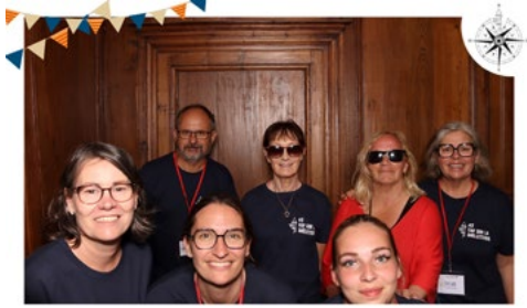
CAP SUR LA GOËLETTERIE #2 | SAINT-MALO | 22 JUIN 2025